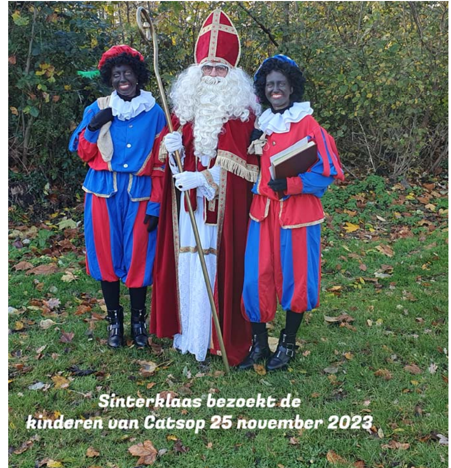
Sinterklaas bezoekt de kinderen van Catsop 25 november 2023

Enkele leden van het bestuur zullen aanwezig zijn om onze buurtgenoten en hun eventuele gasten te trakteren op een glaasje glühwein en een wafel; voor de niet-liefhebbers en de jongeren is er warme chocomel.