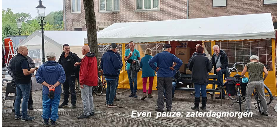
Even pauze: zaterdagmorgen

Uiteraard heeft de commissie een evaluatievergadering gehad. Bij voorbereiding voor 2024 zullen we met name kijken naar de doelgroepen en de promotie van de markt: welke middelen, waar en wanneer.