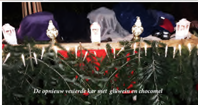
De opnieuw vesierde kar met glühwein en chocomel