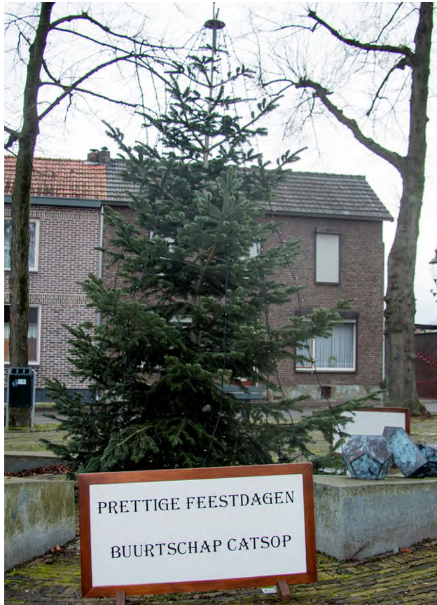
De verlichting in de kerstboom op de Dreespool werd ook dit jaar weer aangebracht door Giel Schumacher Groetjes het "Kaersstalteam".